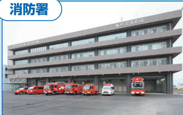
▲諫早市：県央消防本部・諫早消防署