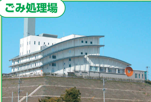
▲西彼杵郡長与町：クリーンパーク長与