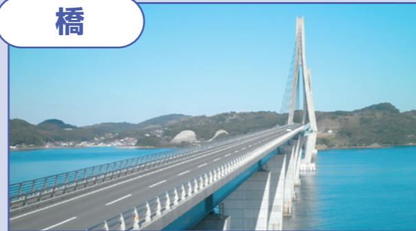
▲松浦市：鷹島肥前大橋