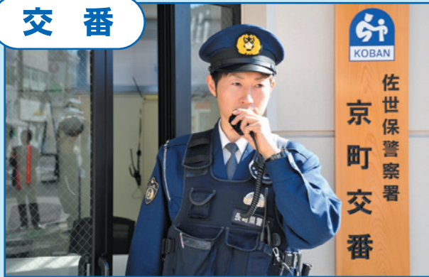
▲市民の生活を守る警察官