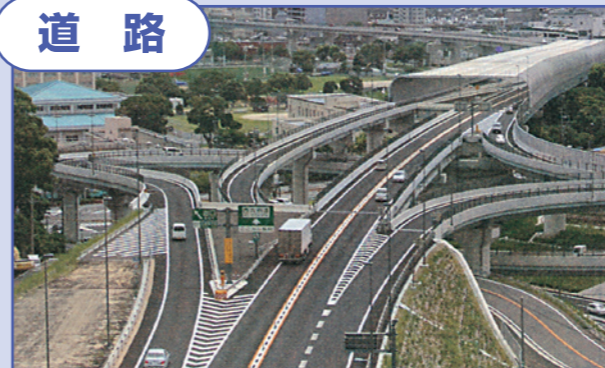
▲佐世保市：西九州道路（佐々佐世保道路）