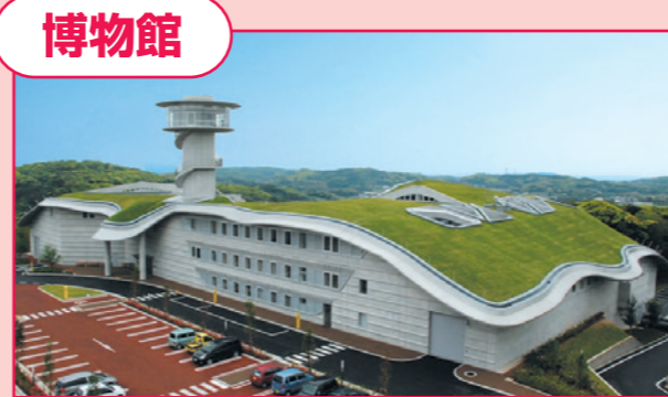
▲壱岐市：一支国博物館